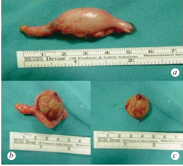
Resim 3a. Apendektomi materyali; 3b. Apendiks lümenine yerleşik taş; 3c. Apendikolitiazis.

feçes üzerine çöküntü oluşturmuş kalsifikasyon izlendi. Apendikal fekalitler ve taşlara çoğunlukla pediatrik ve genç erişkin yaş grubunda rastlanmakta olup çok azı 35 yaş üzerinde görülür. Erkeklerde görülme sıklığı daha çoktur. Semptomsuz olgular, klinik olguların %2'lik grubunu oluştururken, apendikolitiazisli hastaların çoğunluğu semptomatiktir. 5 Asemptomatik olgularda en önemli iki problem radyolojik olarak diğer kalsifiye lezyonlar ile karışabilmesi ve bu olgularda tedavi yaklaşımıdır. İntraabdominal kalsifiye lezyonların radyolojik ayırıcı tanısında kalsifikasyonun yapısı ve lokalizasyonu önemli yer tutar. 6 Apendiks taşları radyolojik olarak genellikle soliter, yuvarlak veya oval, 1–6 cm çapında, radyolüsent görünümüne sahiptirler. Tipik yerleşim yerleri sağ alt kadranda olmasına rağmen apendiks'in anatomik varyasyonlarına göre farklılık gösterebilirler. Bu nedenle üreteral taşlar, kalsifiye pelvik flebolitler, kalsifiye mezenterik lenf nodları ve enterolitiazis ile sıklıkla karışırlar. 3 Direkt grafi ile ayırıcı tanı konulamayan vakalarda BT, radyolojik olarak daha yüksek duyarlılığa sahip olması nedeniyle tercih edilir. 7 Radyolojik olarak kesin tanı konulamayan vakalarda floroskopi kılavuzluğunda laparoskopik eksplorasyon eş zamanlı minimal invaziv tanı ve tedavi imkânı sağlar. 8 Bizim olgumuzda direkt grafi, US ve BT tetkikleri ile kesin tanı konulamadı. Enterolitiazis sebebi olabilecek Meckel divertikülü, Crohn hastalığı veya ince barsak