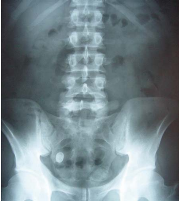
Resim 1. Ayakta direkt karın grafisinde insidental olarak bulunan, yaklaşık 2 cm çapında, sağ sakroiliak bölgeye lokalize, radyoopak yapı.

Dispeptik yakınmaları nedeniyle tetkik edilen 33 yaşındaki erkek hastada, çekilen direkt karın grafisinde, sağ alt kadrana lokalize yaklaşık 2 cm boyutunda kalsifiye lezyon tespit edildi (Resim 1). Takip grafilerinde lezyonun lokalizasyonunda değişiklik olmadı. Ultrasonografi (US) ile çıkan kolon lümeni dışında, abdominopelvik bilgisayarlı tomografi (BT) tetkikinde ise distal ileal segment duvarına komşu, ancak aksiyel kesitsel görüntülemelerde barsak duvarı ile ilişkisi net olarak değerlendirilemeyen, konsantrik kalsifikasyonlar içeren 18x13mm çapında yapı tespit edildi (Resim 2).